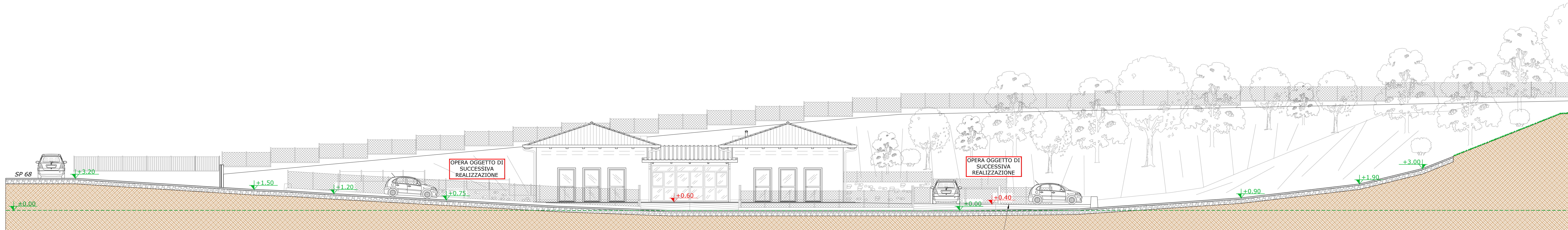
SEZIONE W/W Scala 1:100