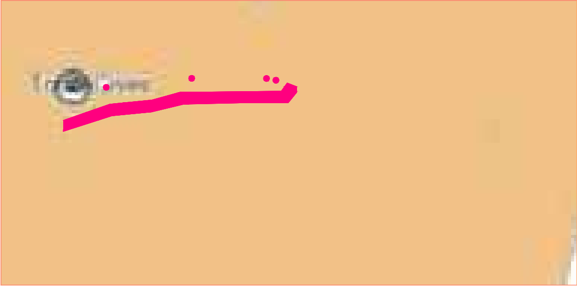
F. 13 n. 51