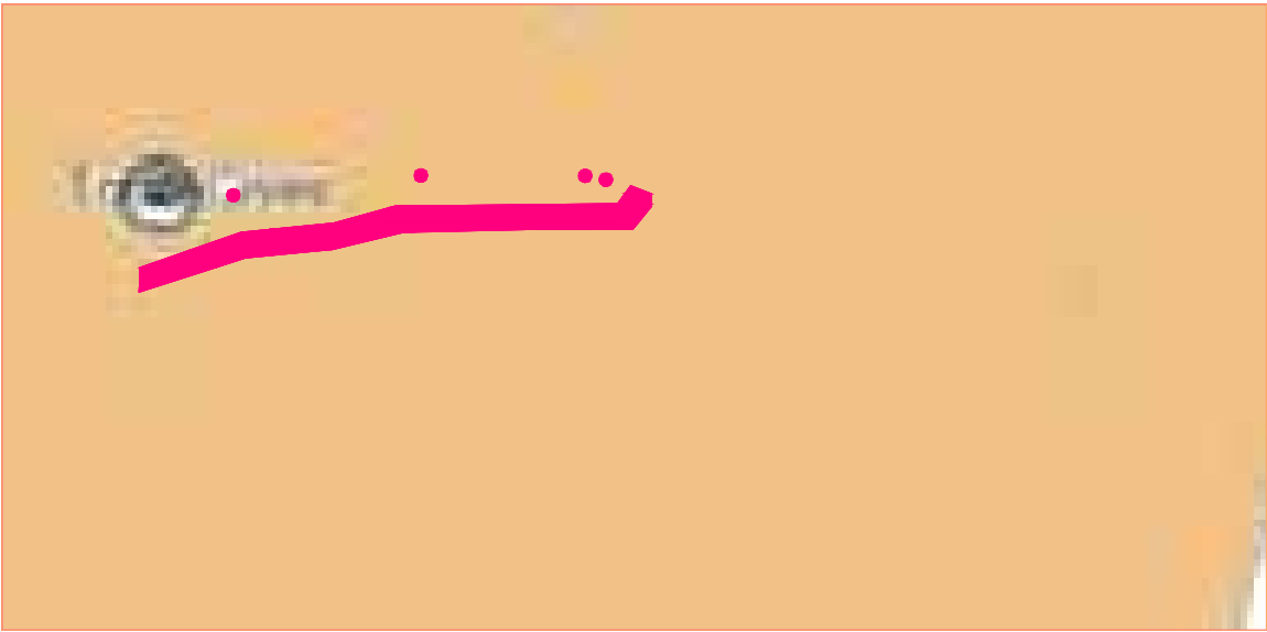
F. 13 n. 51